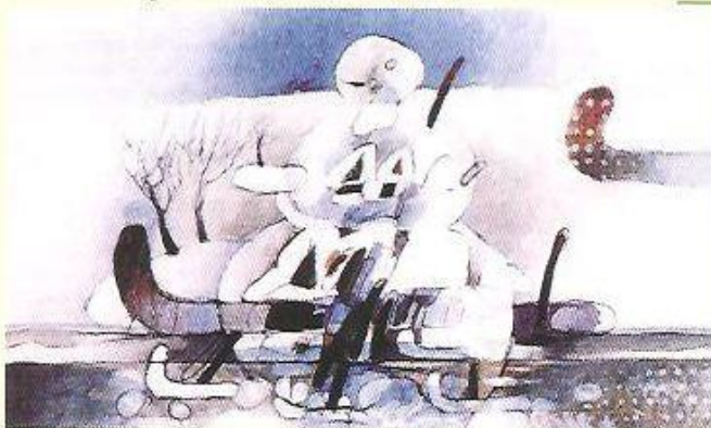
▼ Ladislav Berger: Na saních, 1988

V kapličky sv. Kateřiny ve Znojmě je nástěnná malba Narození Pána z roku 1134. Na Slovensku se témata Narození i Tří králů objevují od 13. století v Kostolanech pod Tribečem, v Košicích, Bardejově, Levoči, Banské Štiavnici ... Tato biblická témata a motivy existují i v současnosti. Zima v krajině a ve městě je však až záležitostí novodobých dějin umění. Častá je od 19. století i v dílech klasiků. "Svoji" zimu viděl a cítil v různých podobách i významech Mikuláš Aleš i Alfons Mucha. Potom zejména malíři 20. století. Právě je fascinovala bílá zimní krajina i magická bělost sněhu. V chladné a mrazivé zimě prociťovali horké lidské vášně, teplo srdce a radost dětských her. Mnozí malovali realistické motivy zimy: Holan, Sedláček, Benka, Fulla, Hála. Jiní vyjadřovali poezii a poetiku zimy: Trnka, Komárek, John, Kíml, ze Slovenska Kompánek, Berger, Kraicová