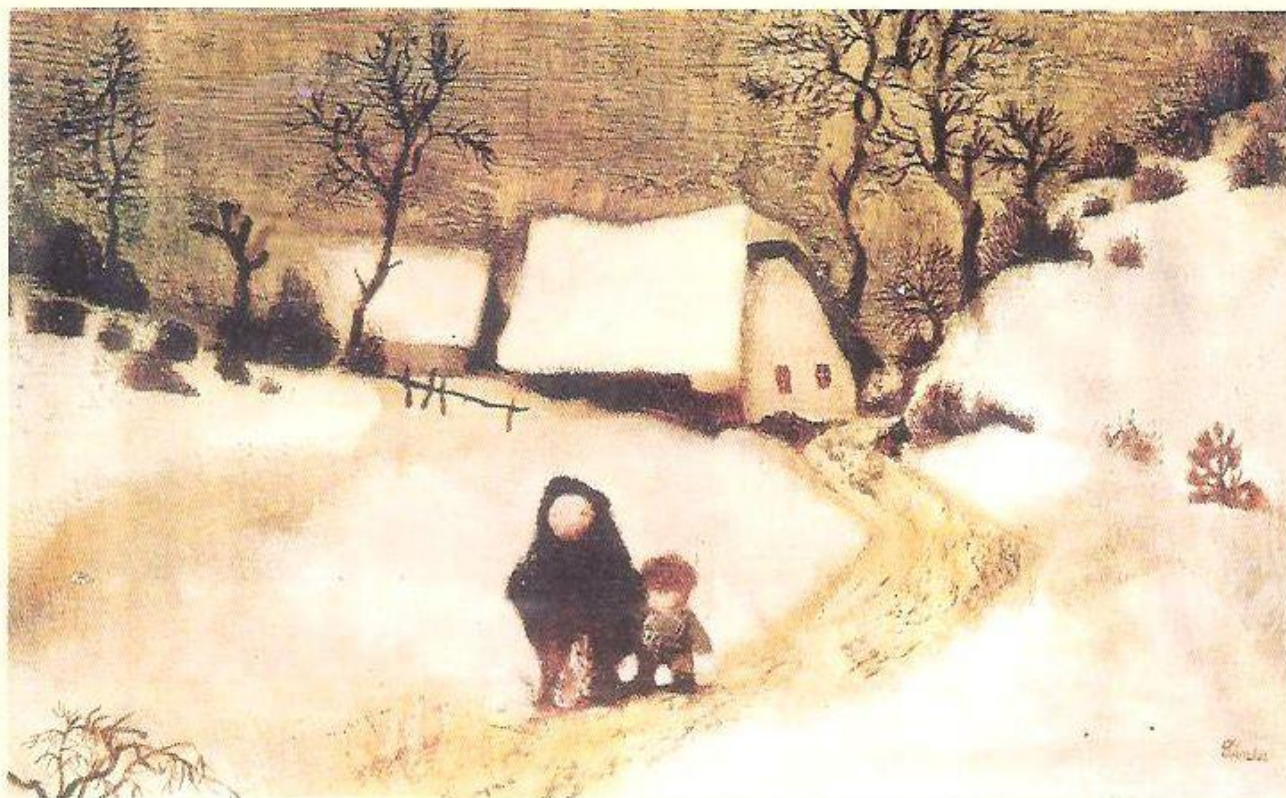
▲ Jiří Trnka: Zimní krajina, 1944