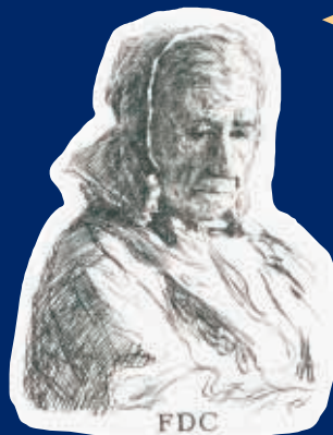
◀ Teta Máry (1898)

život taková díla, která ho postavila mezi přední představitele českého impresionismu v krajinomalbě. Jeho tvorbu je možné rozdělit do tří období. V prvním byl pod vlivem svého profesora na Akademii výtvarného umění v Praze J. Mařáka a lyrizmu A. Chittussiho. V druhém se snažil hlouběji zachytit ráz krajiny a její život. Z té doby jsou například obrazy U nás v Kameničkách nebo Z pohorských motivů. Nejen náladu přírody ale také měst, zejména milované Prahy a člověka v ní, se Antonín Slaviček snažil zachytit na svých obrazech. Právě pohledy na Prahu, na její ulice, náměstí, trhy, sady, představují třetí období Slavičkovy tvorby. Ale do nové emise bylo vybráno dílo z jeho ranější tvorby s názvem Podzim ve Veltrusích. Je