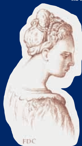
▲ Detail obazu Snímání Krista (kolem 1545)