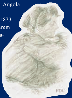
▲ Studie portrétu umělcovy choti (1897)

Představovat osobnost Maxe Švabinského (1873 – 1962) jako plodného umělce se širokým záběrem tvorby by asi bylo zbytečné. Je to všeobecně známo. Vnímali jsme jeho ilustrace i celou řadu malířských a grafických portrétů předních osobností českého politického a kulturního života. Inspirací mu byly i cesty na Slovensko, jak o tom svědčí výstava o působení osobnosti české kultury na Slovensku, která je ještě přístupná v košické Státní vědecké knihovně. Kromě malby a užité grafiky se věnoval také monumentálním realizacím. Ten, kdo navštívil katedrálu sv. Víta v Praze si jistě pamatuje, že autorem návrhů barevných oken a mozaik pro tento český skvost je právě Max Švabinský. Šířku záběru jeho tvorby potvrzují také návrhy bankovek a poštovních známek. Do nejnovější série emise Umělecká díla