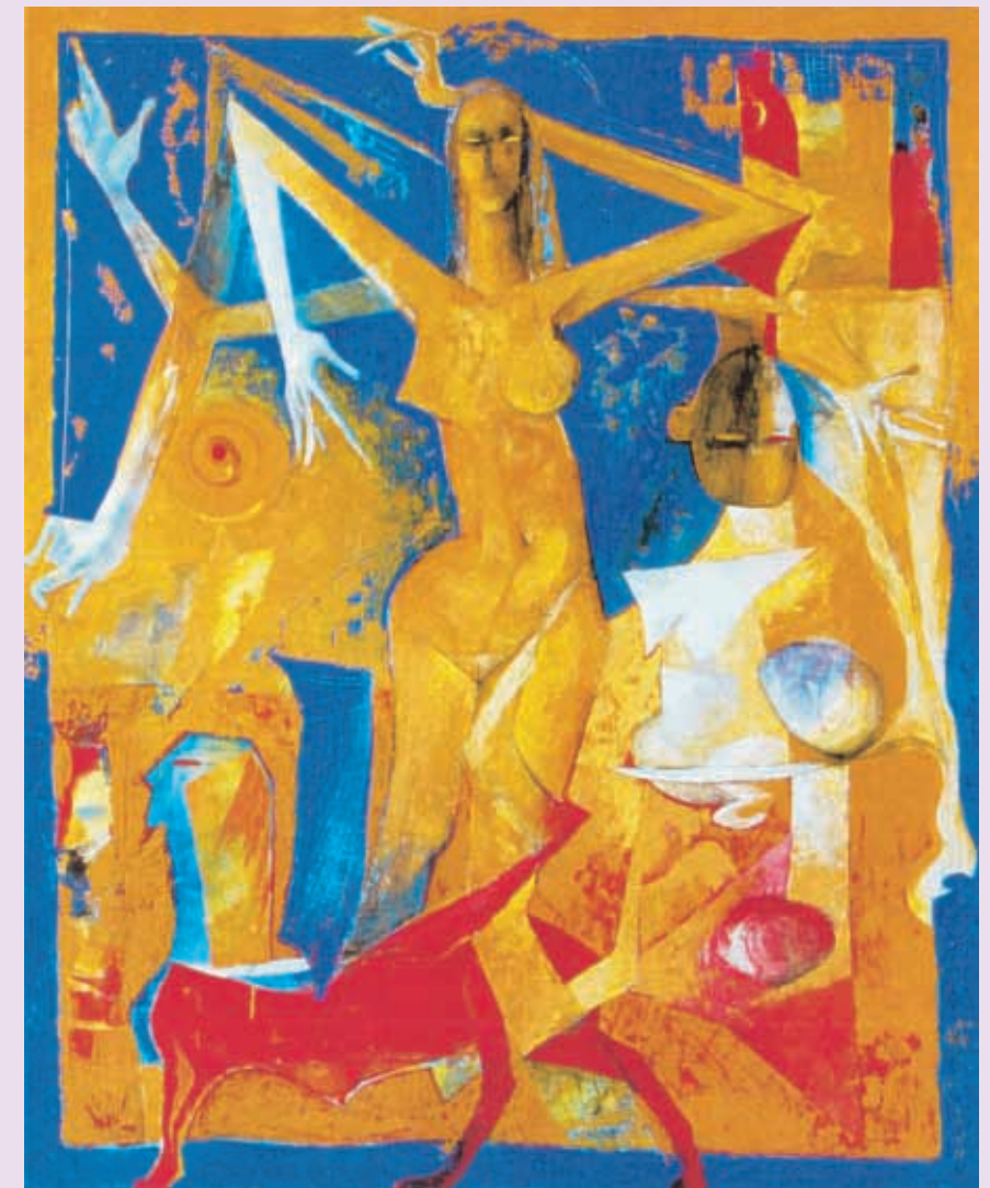
▲ Zákon odrazu I. 2002 akryl 130x160 cm

dru znaku, významu a symbolu. Jeho obrazy působí jako monumenty i postmoderní ikony. Alexej Vojtášek sakralizuje filozofii, historii, lidskou víru i touhy člověka.