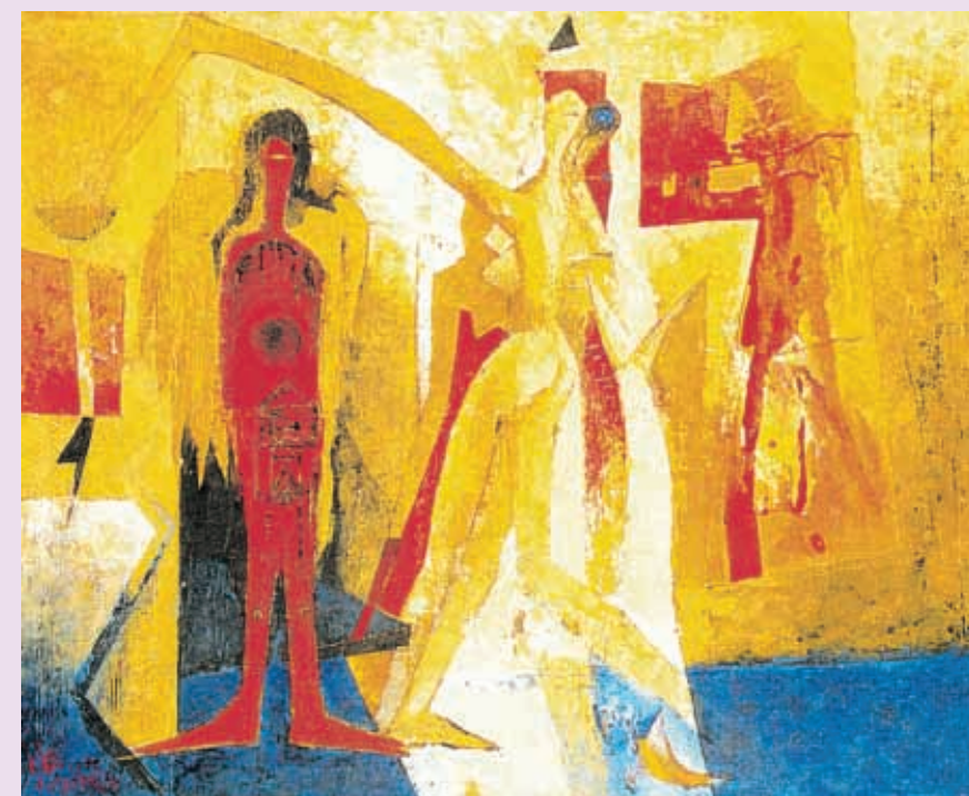
▲ Červený anděl se žlutými křídly 2002 komb. tech. 90x110,5cm