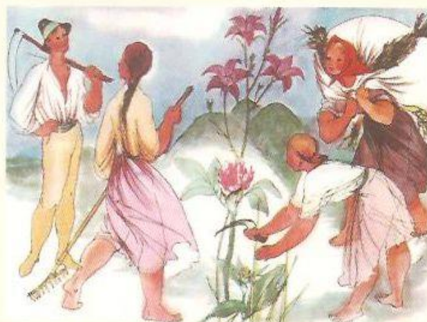
▲ ILUSTRACE KE KNIZE M. VAŠÁKOVÉ: Z POVÍDKY DO POVÍDKY, 1942

linii v ploše a v barevném prostoru blízké fauvistickým principům. Ve svých vrcholech vykristalizovalo toto dílo do jedinečné autorské podoby ryziho výtvarného poetizmu, plného něhy, citu, lásky a porozumění k hodnotě slova i obrazu, myšlenky a činu, skutečnosti i snu. Volné grafiky a zmíněné grafické cykly jsou plné poetických symbolů, akcentují pozitivní fenomény lidské lásky a něžného erotizmu. Epické a lyrické v její tvorbě se mění na harmonickou obrazovou