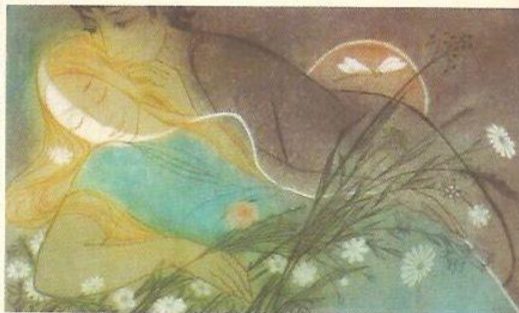
▲ Z CYKLU MANŽELSTVÍ, 1975