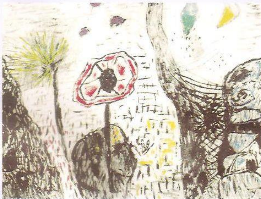
◀ Červený květ, 1991, olej

viděl jsem Vaši jubilejní výstavu. Měla název Slabikář přírody , ale pro mne a jistě i pro mnoho dalších návštěvníků byla zároveň velikou Encyklopedií přírodních metamorfóz , básnickou sbírkou o tajemných zákonitostech přírodního vědomí a bytí a dramatickým spisem o síle a něžnosti kraje a kánonem lyriky, který je dán (před lidmi) i zemi, vodě, vzduchu a ohni ve Vašem srdci i ve Vašich obrazech. Nejedna z Vašich obrazů na této výstavě působil jako Zákoník. Právo a zákon, který hlásal, byl zákonem svobody, zákonem čistého vidění a citlivého doteku člověka a země, země a nebe. Možná se mi to jenom zdálo, ale před jedním