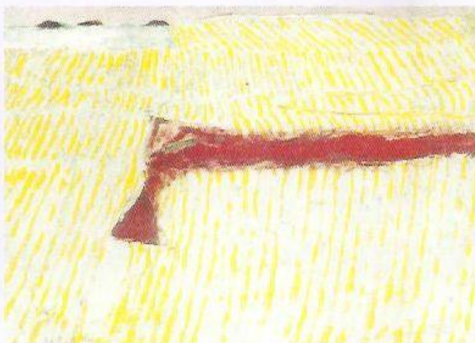
▲ Pole, 1977, olej

On sám a přece i v nespočetných souvislostech se svou krásnou jihočeskou krajinou, se svým životem, se svým osudem. Narodil se 17.2.1909 v Českých Budějovicích. Zde také studoval na Učitelském ústavu (1924-28) a později na Vysoké škole pedagogické v Praze (1933-35). Už v roce 1931 se stal členem avantgardního uměleckého sdružení Linie v Českých Budějovicích. Kreslí, maluje a věnuje se i grafické tvorbě (linoryt, dřevorez a barevný dřevorez, suchá jehla, monotyp, papírotisk). Miluje hudbu. Experimentuje ve fotografii. Poznává podoby a hlavně duši krajiny. Je to pro něho plodná a kouzelná země. Tábořsko, Vitorazsko, Kaplicko... Avšak