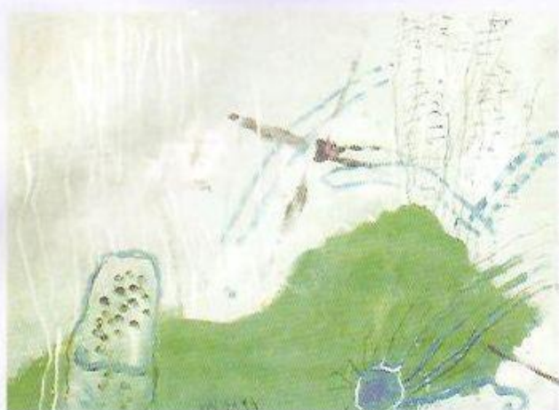
▲ Bez názvu, 1994, kombinovaná technika