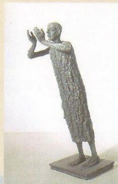
▲ Jidáš, 1975

v nich. Jsou to sochy z tvrdé hmoty ducha života. Modelovány v hlině, která pochází z jeskyň pravěku vědomí a svědomí. Jsou to sochy, které stojíce jdou. Gravituji k zemi, vzpinají se k nebi, krácejí k věčnosti. Jsou oděty do nahoty člověka a do draperie kanelurovaných sloupů. Jsou oděty do gesta rukou a zavřených, vidoucích očí. I postoj je jejich gestem. Gestem touhy po doteku, gestem porozumění a přesvědčení. Jsou to sochy - vykřičníky. Být, anebo - být! Vaše sochy jsou zakotveny samy v sobě a ve Vás. A ve svém osudu a ve Vašem osudu. V soše Olbrama! V lidské soše sochy člověka. Jsou to sochy jsoucna lidských bytostí. Jsou to však i sochy podob a tvarů, objemů i struktur, mlčení a řeči, smyslu života a hladových dlaní vědomí. Ty sochy varují před zakletím a prokletím člověka. Jidáš obrostl srsti zrady, ale Strážce přežil i v rozdrásaném torzu. Josef se naklání k Marii a Eva k věčnosti. Jejich tvůrce je