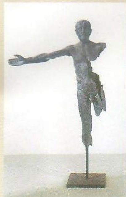
▲ Stražce, 1975