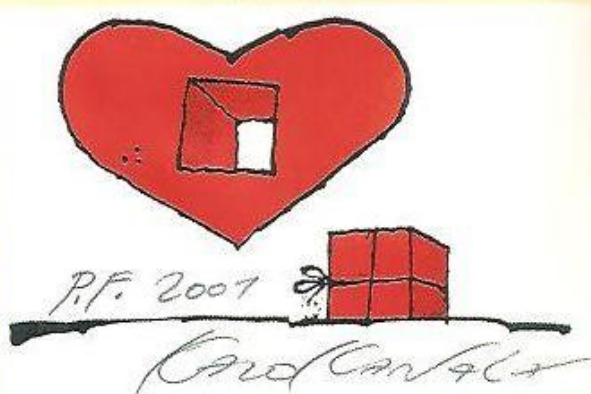
▼ Kazo Kanala