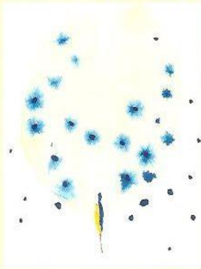
▲ Vojtěch Hurta

jakých asi bude těch 365 dní, co jsou před námi.