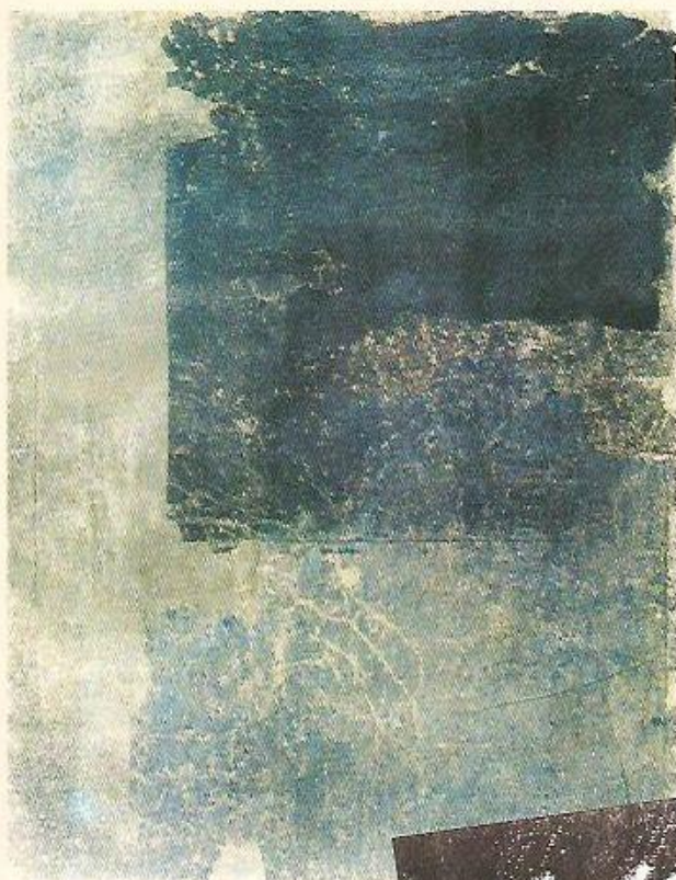
H. 3. 1964, STRUKTURÁLNÍ MONOTYP