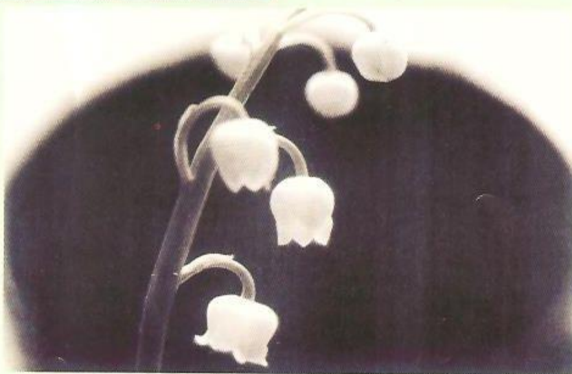
▼ P. ŽUPNÍK, 1996

hodnoty, jistoty i proměny, nálady i atmosféru přírody i města, exteriérů a interiérů, podoby, povrchu i podstaty jevů a člověčenství člověka. Jejich dílo má charakter fotografické imprese i exprese, dokumentu a svědectví, výzvy i vyznání. Jsou to fotografie, které povídají a popisují, analyzují, zviditelňují. Jsou prostým a čistým vizuálním faktem, ale jsou i stylizované a inscenované. V něčem se vracejí až k počátkům umění fotografie, v mnohém korespondují s moderním výtvarným viděním a projevem (op art, pop art, konceptuální umění, land art, body art ...), pracují a tvoří s vizuálním znakem a mnohovýznamovým