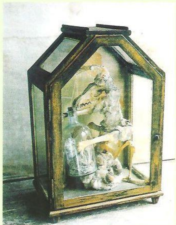
▲ Merkuriáš se synem (z cyklu alchymie, 1994)

o citovém životě krystalů? A přece se acháty milují. Co my víme o traumatu zrození? No přece radost, krásu a trauma života. Jan Švankmajer promluvil. Svoji tvorbou i svým hlasem při přejímání Českého lva. Lev patří lvu. Otesánek se možná nasýtil. Jan Švankmajer je však stále hladový po životě a umění.