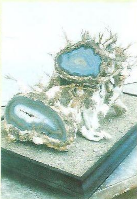
▲ Kopulující acháty, 1994