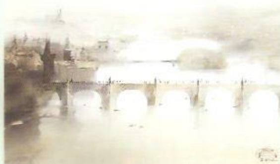
▲ KARLŮV MOST

především novou tvorbou - akvarely. Zpočátku nacházíme v akvarelech motivy přírody, krajiny, vize proměn a reflexe pocitů. Potom se soustřeďuje na architekturu. Úžasné jsou jeho monumentální průčelí gotických katedrál a věže pronikající do nebe. Později realizuje pohledy na města. Je to hlavně Pra-