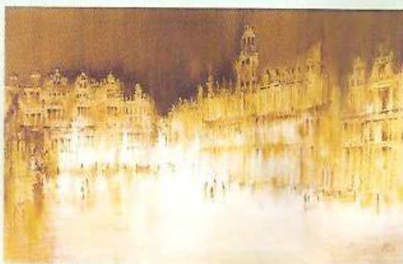
▲ KARLŮV MOST

i energie ducha. Myšlenka i pozitivní humanistické poselství. Spolu s komorní plastikou vznikají i některé monumentální sochařské realizace v architektuře. Podílí se na dořešení památníku v Lidicích, jeho dílo je