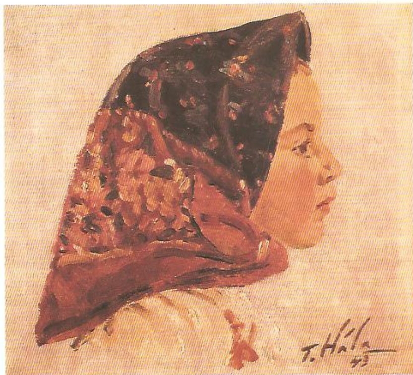
Jan Hála: Hlava dívky se šátkem, 1943, olej.

První rok ve Važci byl dost těžký. Jan Hála žil tak trochu jako poustevník, sám, odloučený od světa, který mu mimochodem ani moc nescházel. Mimo štětec bere do ruky i pero a píše do Lidových novin o svém Važci. A hle, několik šťastných fejetonů ho spojilo se světem. Lidé se o něm dověděli. "Dveře mojí dřevěnice se začaly otvírat návštěvám nejen domácím, ale i z daleké ciziny." Jinak umělecký život v tom čase ve Važci byl rušný. Přicházeli sem Jaroslav Augusta, Martin Benka, Miloš Bazovský, bratři Úprkovi, Janko Alexy,