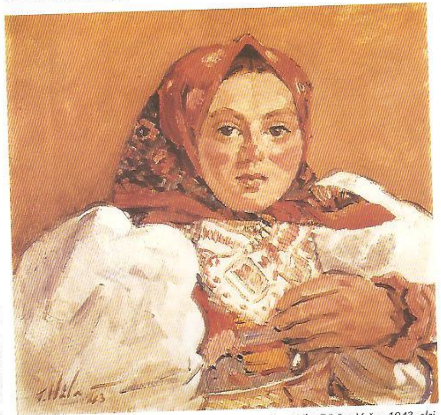
Jan Hála: Děvče z Važce, 1943, olej.