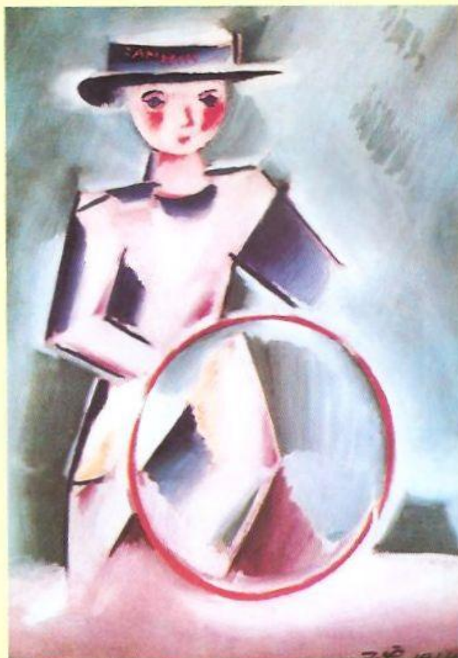
Jozef Čapek: Chlapec s obručí, 1914

Ostravské galerii se soustavnou akviziční činností podařilo řešit nejen zastoupení těchto autorů v expoziční sbírce, ale vytvořit i obsažné vývojové soubory jednotlivců s důrazem na těžiště jejich hlavních osobnostních přínosů. Z těchto celků je vybrán výstavní soubor nejen připomínající dnes již slavná jména předních osobností české výtvarné historie, z nichž připomeneme Bohumila Kubištu, Emila Fillu, Antonína Procházku, Otakara Kubína, Williho Nowaka, Josefa Čapka, Otakara Kremlíčku,