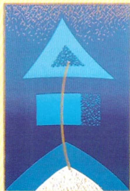
Novoroční pozdrav, 1996, serigrafie