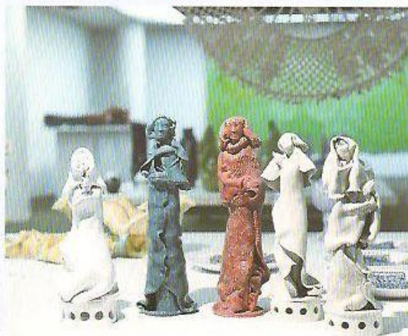
▲ E. LUGSOVÁ, Skupina figurálních keramik, 1974