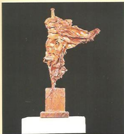
▲ NIKÉ, 1998, komb. technika