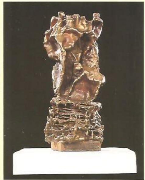
▲ HONBA NA ČARODĚJNICE, 1998