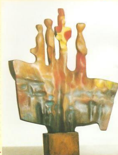
TITANIK, 1992, třešeň-polichrom ►