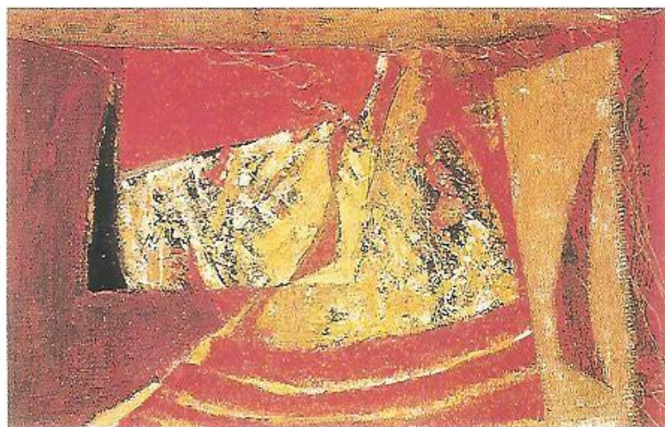
▲ R. Fila: Sluneční zátiší , 1962, olej

Pražská aktivita inspirovala některé generačně i názorově blízké umělce z Bratislavy. Setkali se u malíře Mariána