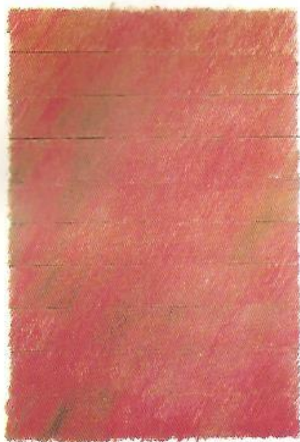
▲ M. Urbánek: K-83-56, 1983