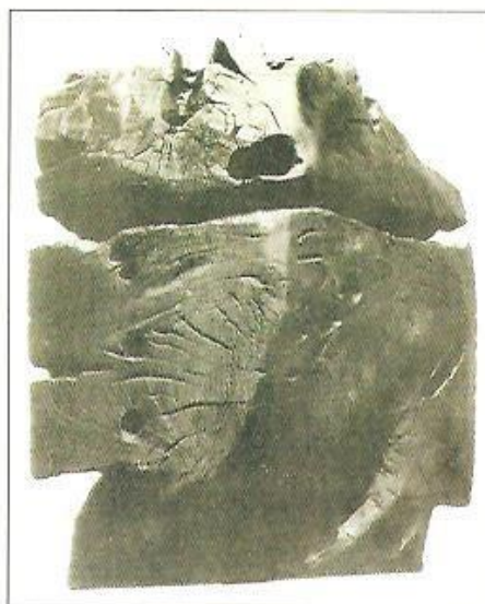
◀ J. Koblasa: Moby Dick , 1963

zace hmoty v podobě moderního veraikonu - symbolu času, jeho plynutí a proměn ve výškách i hloubkách lidských osudů této doby.